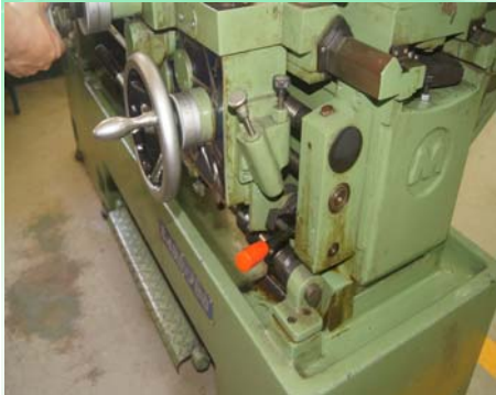
主軸馬達啟動開關