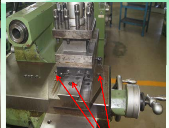
複式刀座打角度需鬆開3顆螺絲