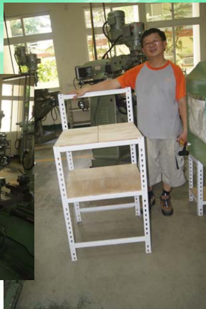
可變換檯面大小置物架60cm*60cm